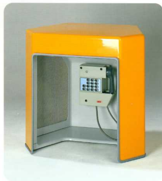
▲ Refuge PM