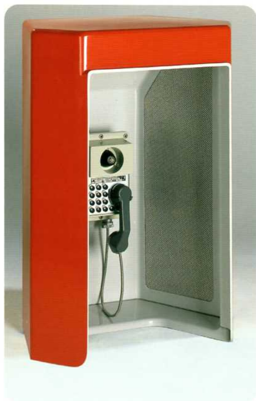
▲ Refuge GM